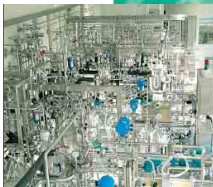
Antikörper-Küche: In der Laborzentrale von Roche stellen 4000 Mitarbeiter Anti-Krebs-Körper her.

Über 100 Münchnerinnen schon ausprobiert. „Die waren alle begeistert.“