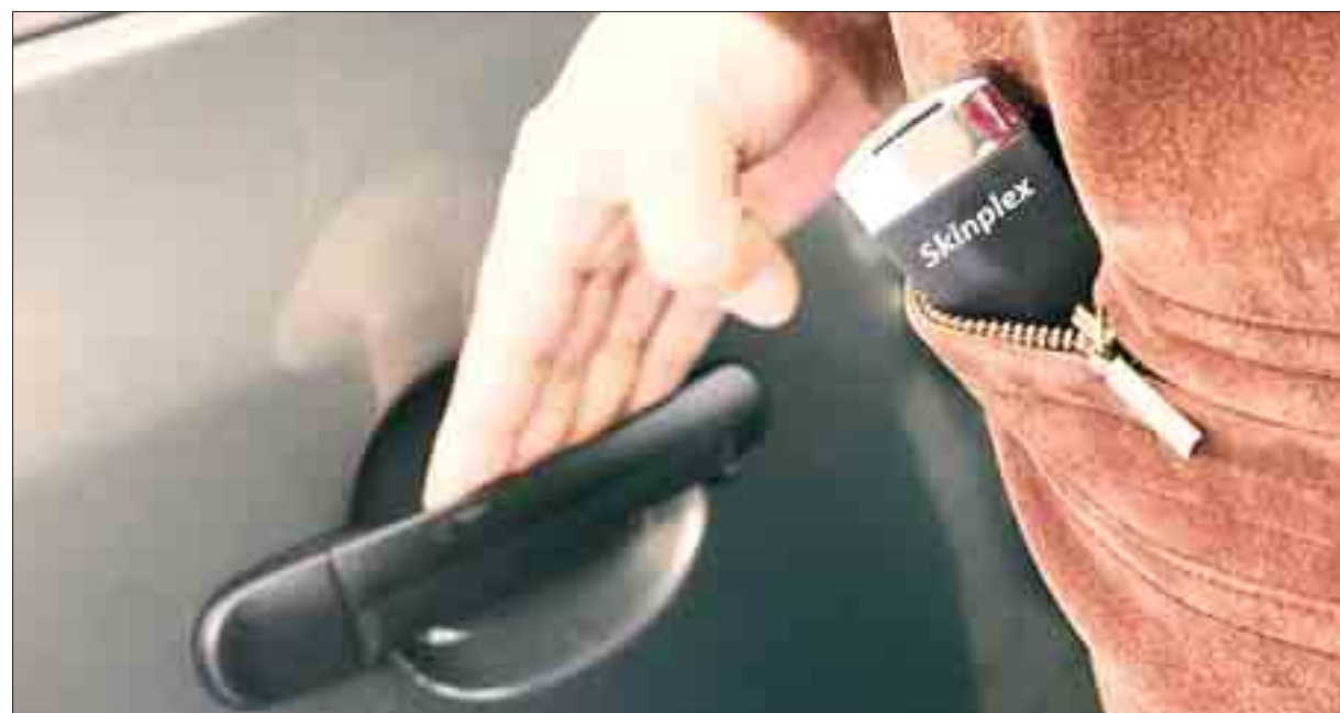
Magische Technologie: Die Firma Ident Technology aus Wessling hat eine Karte hergestellt, die ein elektrisches Feld über die Haut ihres Besitzers leitet – Türen erkennen das Feld und öffnen sich von allein. Das soll künftig auch mit Waffen oder Handys gehen.