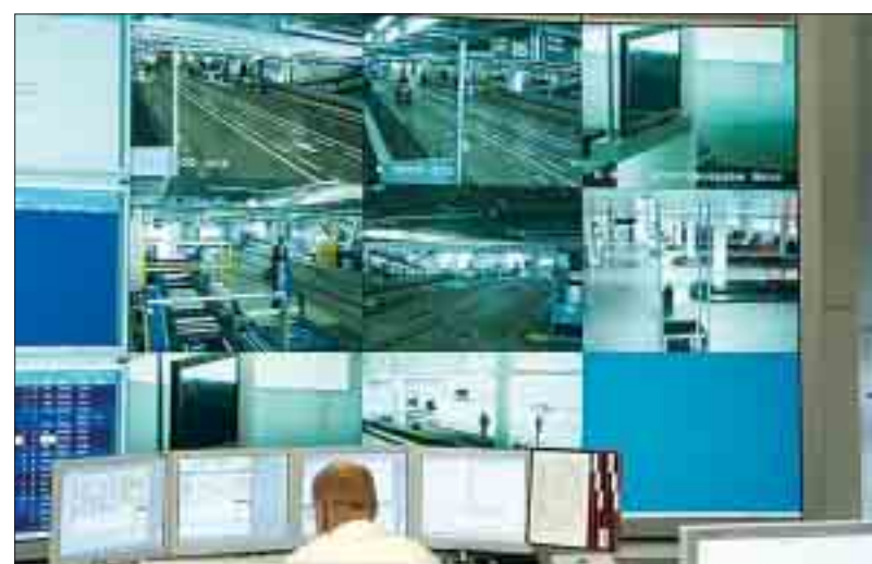
Siemens sorgt für Sicherheit: Sicherheitsanlagen wie hier auf dem Münchner Flughafen wurden in ihren Grundlagen in München-Perlach erdacht.