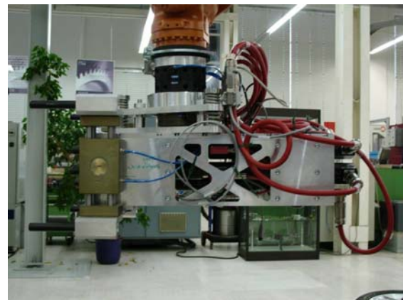
Bild 1: links: Gesamtansicht mit einem auf einer Linearachse montierten KUKA-Roboter und einer durch eine Elektrohängebahn transportierten Karosserie; rechts: Detailansicht des Endeffektors mit nachgiebigem Kraft-Momentensensor